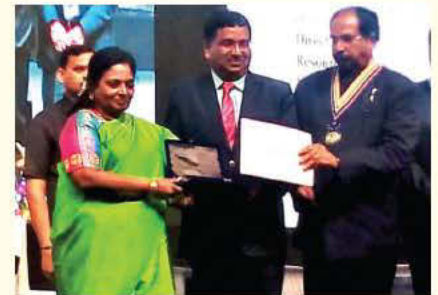
तेलंगाना की माननीय राज्यपाल के हाथों पुरस्कार ग्रहण करते एएसएल के वरिष्ठ वैज्ञानिक

इन्स्टीट्यूशन ऑफ इंजीनियर्स (इंडिया) के नेशनल डिजाइन एंड रिसर्च फोरम (एनडीआरएफ) द्वारा यांत्रिक इंजीनियरी में राष्ट्रीय अभिकल्प पुरस्कार-2019 से सम्मानित किया गया है। आपको