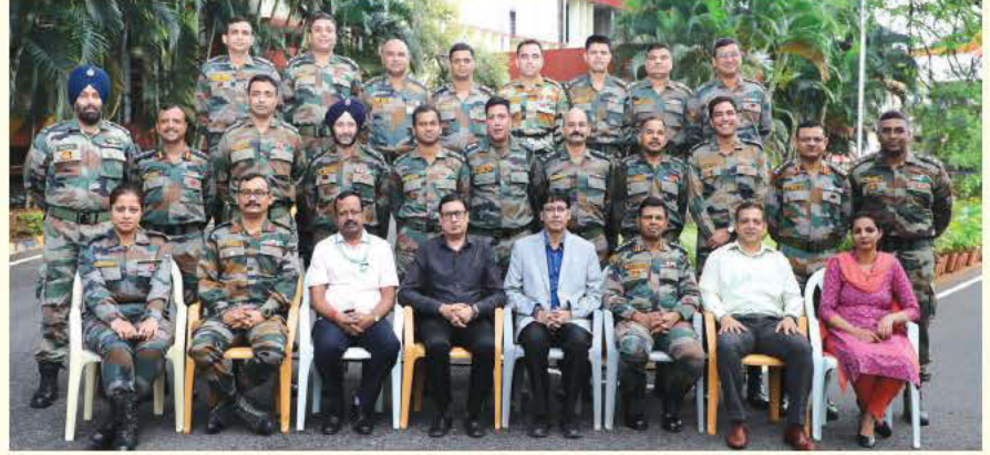
डीएफआरएल, मैसूर द्वारा आयोजित पाठ्यक्रम के अवसर का ग्रुप फोटो

पाठ्यक्रम के एक हिस्से के रूप में खाद्य प्रसंस्करण से संबंधित विभिन्न