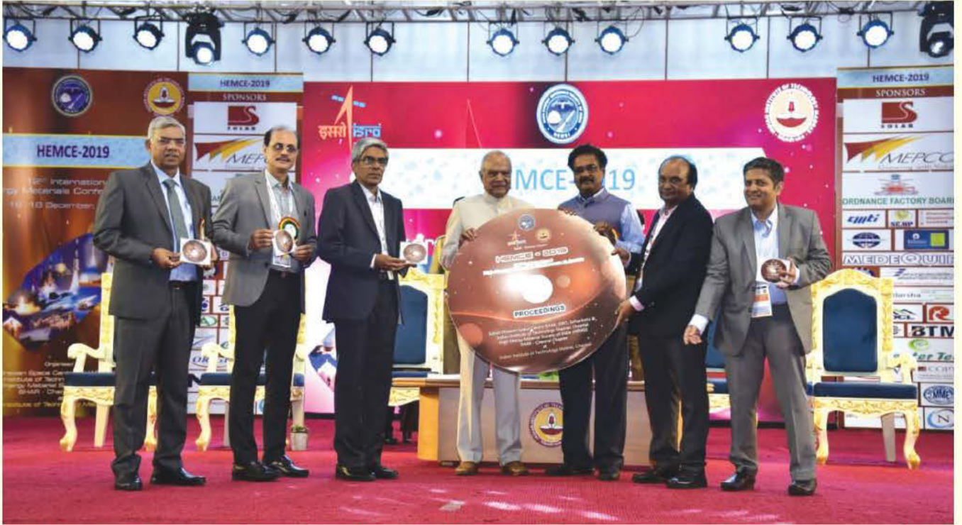
तमिलनाडु के महामहिम राज्यपाल श्री बनवारी लाल पुरोहित 12वे अंतर्राष्ट्रीय उच्च ऊर्जा पदार्थ सम्मेलन एवं प्रदर्शनी के उद्घाटन अवसर का ग्रुप फोटो

(सीएसआईआर), परमाणु ऊर्जा विभाग (डीएई), विद्युत मंत्रालय (एमओपी), अकादमिक संस्थानों तथा उद्योगों से आए 550 से भी अधिक प्रतिनिधियों ने भाग लिया। इस सम्मेलन में अमेरिका, यूनाइटेड