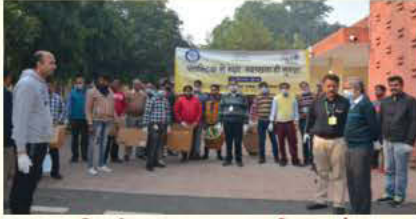
इनमास, दिल्ली द्वारा स्वच्छता अभियान के अवसर पर सामुहिक फोटो

नाभिकीय औषधि तथा संबद्ध विज्ञान संस्थान (इनमास), दिल्ली में 1 दिसंबर से 15 दिसंबर 2019 के दौरान एक