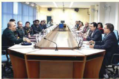
निदेशक, डिपास संस्थान में पधारे अतिथियों के साथ विचार-विमर्श करते हुए