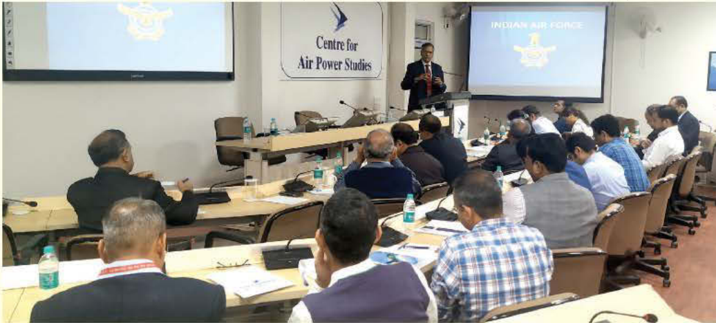
ईसा, दिल्ली में आयोजित प्रशिक्षण कार्यक्रम के सत्र का ग्रुप फोटो

तथा अनुकार हेतु हवाई अभियान एवं सामरिक प्रक्षेत्र' विषय पर सेंटर फॉर एयर