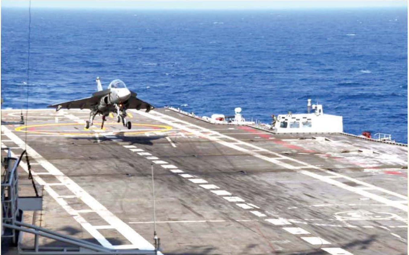
आईएनएस विक्रमादित्य पर एलसीए-नेवी की पहली सफल अरेस्टेड लैंडिंग

विभाग के सचिव एवं डीआरडीओ के अध्यक्ष डॉक्टर जी. सतीश रेड्डी ने इस अत्यधिक विस्मयकारी सफलता को प्राप्त करने के लिए वैमानिकी विकास एजेंसी (एडीए), भारतीय नौसेना, हिंदुस्तान वैमानिकी लिमिटेड (एचएएल), वैज्ञानिक तथा औद्योगिक अनुसंधान परिषद (सीएसआईआर) और वैमानिकी गुणता आश्वासन महानिदेशालय (डीजीएक्यूए) की टीमों को बधाई दी।