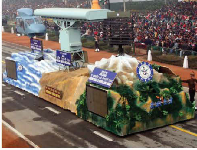
मानव संसाधन विकास संबंधी क्रियाकलाप