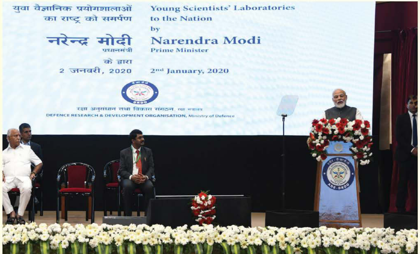
प्रधानमंत्री नरेन्द्र मोदी द्वारा युवा वैज्ञानिक प्रयोगशालाओं का राष्ट्र को समर्पण

इनमें से प्रत्येक प्रयोगशाला एक विशिष्ट प्रौद्योगिकी के क्षेत्र में कार्य करेगी जैसे कि कृत्रिम बुद्धिमत्ता, क्वांटम प्रौद्योगिकी, संज्ञानात्मक प्रौद्योगिकी, असममित प्रौद्योगिकी तथा स्मार्ट सामग्रियों से संबंधित प्रौद्योगिकी। तेजी से विकसित हो रही कृत्रिम बुद्धिमत्ता के क्षेत्र में अनुसंधान से संबंधित कार्य बेंगलुरु युवा वैज्ञानिक प्रयोगशाला में किया जाएगा; क्वांटम प्रौद्योगिकी से संबंधित कार्य आईआईटी मुंबई में; संज्ञानात्मक प्रौद्योगिकी से संबंधित कार्य आईआईटी चेन्नई में; असममित प्रौद्योगिकियों से संबंधित नए एवं अधुनातन क्षेत्र में अनुसंधान का कार्य जादवपुर विश्वविद्यालय, कोलकत्ता के परिसर में; तथा स्मार्ट पदार्थों तथा उनके अनुप्रयोग के महत्वपूर्ण क्षेत्र में अनुसंधान एवं उनके अनुप्रयोग से संबंधित कार्य हैदराबाद में किया जाएगा।