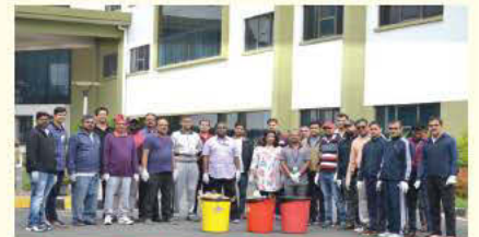
डेयर, बेंगलुरु द्वारा प्लॉगिंग रन के अवसर पर सामूहिक फोटो

कचरे को उठाने के लिए 7 दिसंबर 2019 को प्लॉगिंग रन का आयोजन किया। इस कार्यक्रम में रक्षा उड्डयानिकी अनुसंधान स्थापना (डेयर) के निदेशक तथा अधिकारियों एवं कर्मचारियों ने अत्यधिक उत्साह एवं उमंग के साथ भाग लिया।