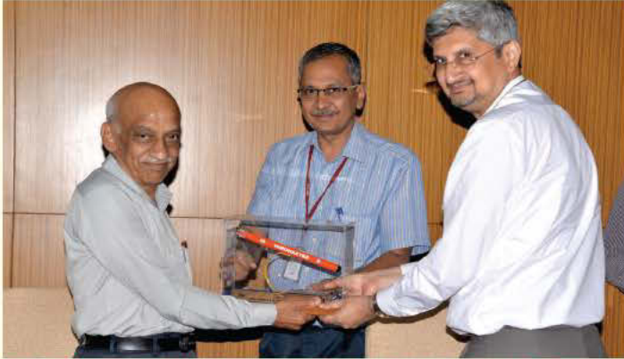
नौसेना विज्ञान तथा प्रौद्योगिकी प्रयोगशाला (एनएसटीएल) में भारतीय अंतरिक्ष अनुसंधान संगठन (इसरो) के पूर्व अध्यक्ष ए. एस. किरण कुमार का अभिर्नंदन किया जा रहा है