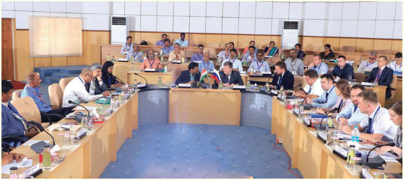
एनपीओएल, कोच्ची में आईआरआईजी-सीएम-एमटीसी की मध्यावधिक बैठक