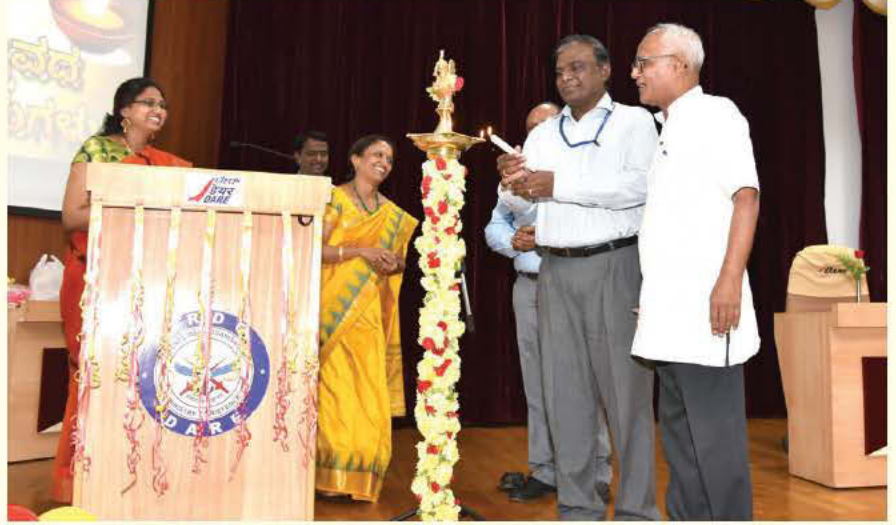
डेयर, बेंगलुरु में कर्नाटक राज्योत्सव का आयोजन