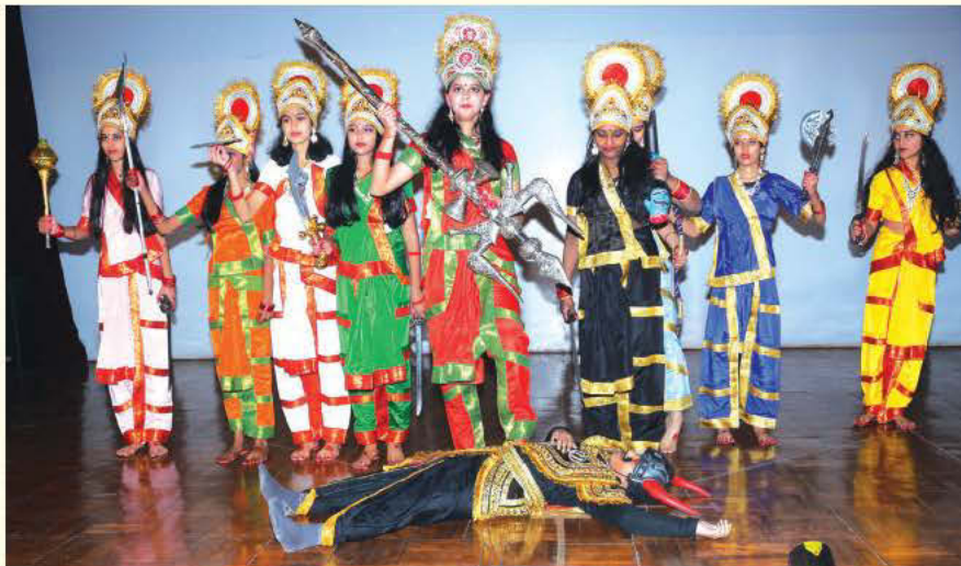
रक्षा अनुसंधान तथा विकास स्थापना (डीआरडीई) के स्थापना दिवस समारोह के दौरान आयोजित किए गए सांस्कृतिक कार्यक्रमों की एक झलक

वैज्ञानिक तथा निदेशक, डीआरडीई ने इस समारोह का उद्घाटन किया तथा अपने उद्घाटन भाषण में आपने वर्ष 2019 के दौरान रक्षा अनुसंधान तथा विकास स्थापना (डीआरडीई) द्वारा प्राप्त की गई उल्लेखनीय