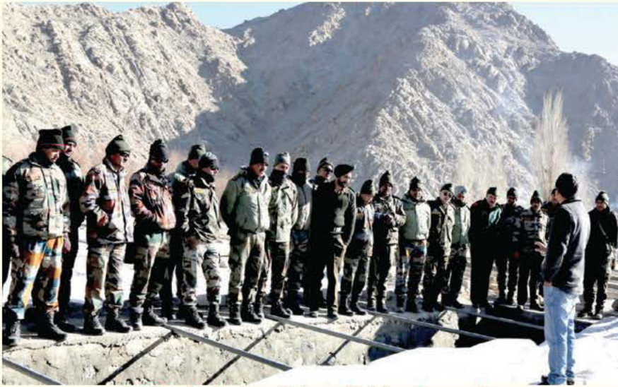
सियाचिन और लेह सेक्टर में सैन्य कार्मिकों हेतु प्रशिक्षण कार्यक्रम

लद्दाख क्षेत्र में सैन्य बलों की आवश्यकताओं के अनुसार रक्षा उच्च तुंगता अनुसंधान संस्थान (डिहार), लेह ने लेह गैरिसन में तैनात किए गए सैन्य