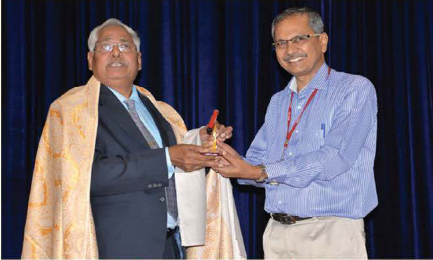
एनएसटीएल, विशाखापत्तनम में संविधान दिवस समारोह का आयोजन

नौसेना विज्ञान तथा प्रौद्योगिकी प्रयोगशाला (एनएसटीएल) ने संविधान दिवस के अवसर पर गीतम स्कूल ऑफ