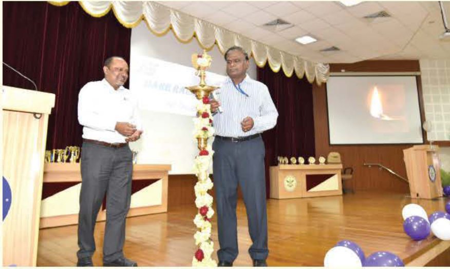
रक्षा उड्डयानिकी अनुसंधान स्थापना (डेयर) बेंगलुरु में स्थापना दिवस समारोह का उद्घाटन समारोह

के दौरान रक्षा उड्डयानिकी अनुसंधान स्थापना (डेयर) द्वारा प्राप्त की गई विभिन्न तकनीकी एवं प्रशासनिक उपलब्धियों के संबंध में विस्तार से बताया। अपने भाषण