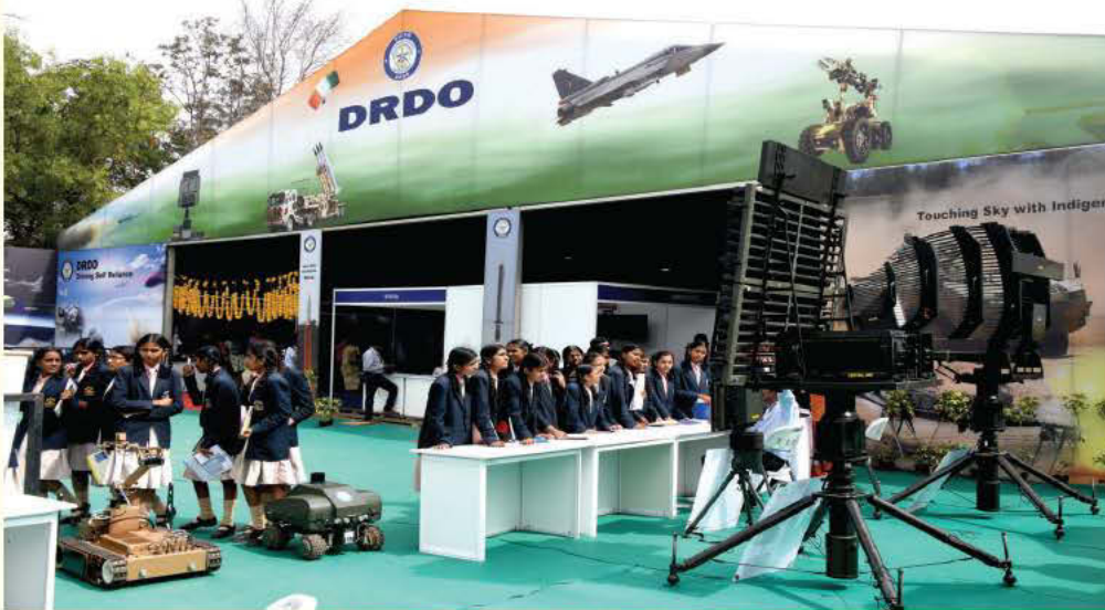
107वें भारतीय विज्ञान कांग्रेस में डीआरडीओ पवेलियन

इनडोर प्रदर्शनों में वायुवाहित पूर्व चेतावनी एवं नियंत्रण प्रणाली (अवाक्स), यूएवी रुस्तम-1 और तपस, निर्भय मिसाइल, आकाश मिसाइल प्रणाली, पृथ्वी मिसाइल, नाग मिसाइल, हेलिना, मारीच-उन्नत टारपीडो रक्षा प्रणाली, बुखारी हीटिंग प्रणाली, पैकेज में रखे गए खाए जाने के लिए तैयार रेडी-टू-ईट खाद्य पदार्थ हैं जो सभी शामिल किए गए थे। डीआरडीओ का पवेलियन इस प्रदर्शनी को देखने आए लोगों तथा छात्रों के लिए एक बड़ा आकर्षण का केंद्र था। इस अवसर पर पवेलियन को देखने आए लोगों को डीआरडीओ द्वारा प्रदर्शित की गई इन प्रौद्योगिकियों पर काम करने वाले डीआरडीओ के वैज्ञानिकों के साथ परस्पर बातचीत करने का भी अवसर मिला।