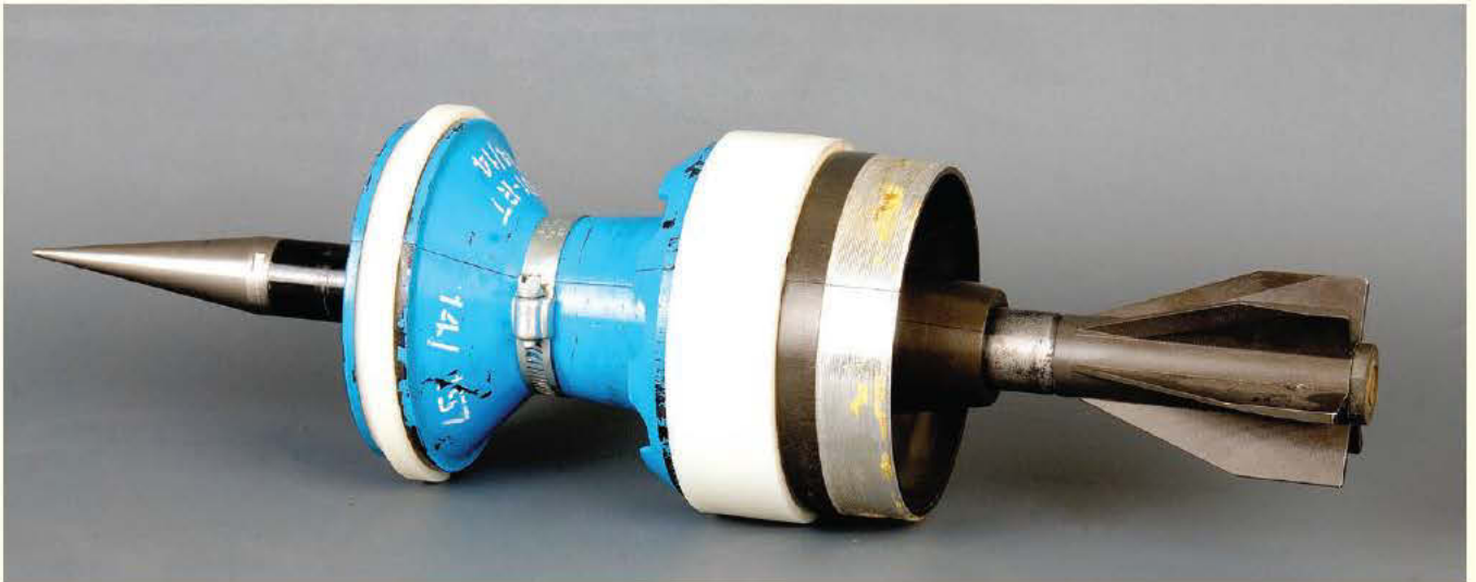
125 मिमी एफएसएपीडीएस

द्वारा किए जाने वाले परीक्षण एवं प्रयोक्ता के स्तर पर किए जाने वाले परीक्षण सफलतापूर्वक एवं संतोषजनक रूप में पूर्ण किए जा चुके हैं और इन परीक्षणों द्वारा इन आयुधों से संबंधित विभिन्न पैरामीटरों जैसे कि लो इक्विवैलेंट फुल चार्जर्स (ईएफसी) पैरामीटर, लो रिकोशेट रेंज तथा वांछित सांतत्य से संबंधित पैरामीटरों को सफलतापूर्वक स्थापित किया गया है। प्रयोक्ता परीक्षणों का अंतिम चरण के रेंज अहमदनगर में 23-24 दिसंबर 2019 के दौरान सफलतापूर्वक पूरा किया गया। अब यह अभ्यास आयुध भारतीय थल सेना में शामिल किए जाने के लिए पूर्णतः तैयार है। इस आयुध को भारतीय थल सेना में शामिल किए जाने से राजकोष की भारी बचत होगी।