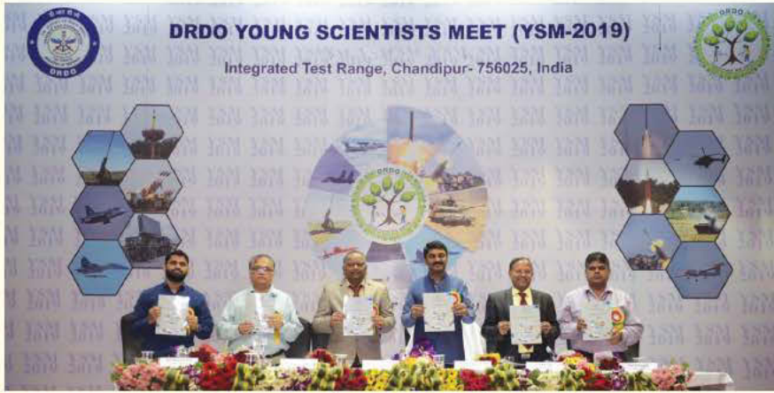
आईटीआर, चांदीपुर में डीआरडीओ युवा वैज्ञानिक सम्मेलन