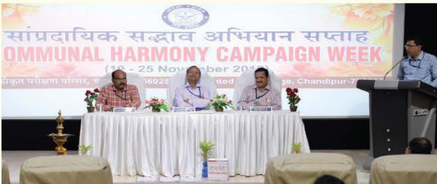
आईटीआर, चांदीपुर द्वारा सांप्रदायिक सद्भाव सप्ताह का आयोजन

एकीकृत परीक्षण परिसर (आईटीआर), चांदीपुर में 19-25 नवंबर 2019 के दौरान सांप्रदायिक सद्भाव अभियान सप्ताह 2019