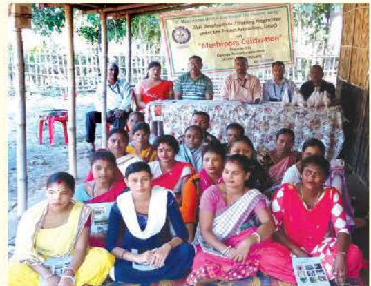
डीआरएल, तेजपुर द्वारा मशरूम की खेती पर प्रशिक्षण कार्यक्रम

कार्यक्रम में कुल 25 स्थानीय किसानों ने भाग लिया। प्रशिक्षण कार्यक्रम के दौरान प्रतिभागियों को मशरूम के पौषणिक लाभों के बारे में और विशेषकर ग्रामीण महिलाओं के स्वयं सेवा समूहों के लिए आय