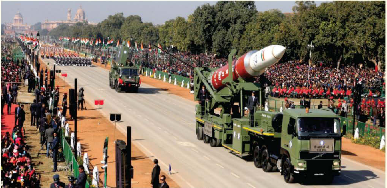
गणतंत्र दिवस परेड में उपग्रह रोधी मिसाइल का प्रदर्शन