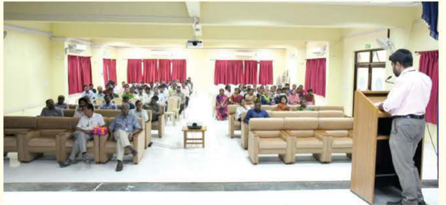
केयर, बेंगलुरु में संविधान दिवस समारोह का आयोजन

कृत्रिम ज्ञान तथा रोबोटिकी केंद्र (केयर), बेंगलुरु, में 26 नवंबर 2019 को संविधान दिवस मनाया गया। डॉक्टर जी. अतिथन, डीआरडीओ केयर तथा पूर्व महानिदेशक (एमसीसी) इस समारोह के मुख्य अतिथि थे। डॉ. सुब्रत रक्षित, उत्कृष्ट वैज्ञानिक तथा स्थानापन्न निदेशक, केयर ने इस अवसर पर कृत्रिम ज्ञान तथा रोबोटिकी केंद्र (केयर) के सभी