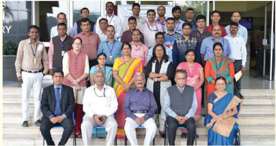
एचईएमआरएल, पुणे में आयोजित सीईपी पाठ्यक्रम का ग्रुप फोटो

इस पाठ्यक्रम के दौरान ठोस रॉकेट नोदक मोटरों के लिए पायरो तकनीकी इग्निशन प्रणाली के संबंध में एक व्यापक जानकारी प्रदान की गई और इसके साथ ही पायरोजन इग्निशन प्रणालियों एवं इनीशिएशन प्रणालियों के बारे में संक्षिप्त जानकारी प्रदान की गई। इस पाठ्यक्रम के दौरान संकल्पना से लेकर उत्पाद निर्माण तक के विभिन्न अभिकल्प पहलुओं, अत्याधुनिक प्रौद्योगिकी के क्षेत्र में हुई प्रगति, विशिष्ट अनुप्रयोग, नवीनतम विकसित एवं प्रदर्शित सैद्धांतिक उपागम, संगठनात्मक