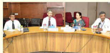
इसरो के पूर्व प्रमुख द्वारा एनएसटीएल, विशाखापत्तनम के कार्मिकों के समक्ष व्याख्यान देते हुए

भारतीय अंतरिक्ष अनुसंधान संगठन (इसरो) के पूर्व अध्यक्ष ए. एस. किरण कुमार ने 5 नवंबर 2019 को नौसेना विज्ञान तथा प्रौद्योगिकी प्रयोगशाला (एनएसटीएल), विशाखापत्तनम का दौरा किया। इस अवसर पर एनएसटीएल के कर्मचारियों को दिए गए अपने अत्यधिक ज्ञानवर्धक व्याख्यान में संस्थान के निरीक्षण पर आए माननीय अतिथि ने भारतीय अंतरिक्ष अनुसंधान संगठन (इसरो) द्वारा थुंबा में सार्जिडिंग