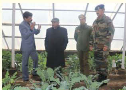
लद्दाख संघ राज्य क्षेत्र के माननीय उप राज्यपाल द्वारा डिहार, लेह का दौरा