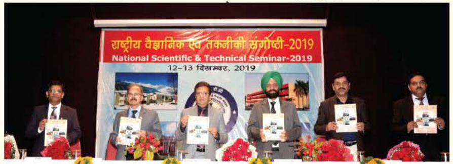
सासे, चंडीगढ़ द्वारा दो दिवसीय 'राष्ट्रीय वैज्ञानिक एवं तकनीकी संगोष्ठी-2019' का आयोजन

व्यापक कार्यक्षेत्र के संबंध में विस्तार से बताया जिनके बारे में इस सेमिनार के दौरान विचार-विमर्श किया जाना था। सेमिनार के आठवें तकनीकी सत्र के दौरान डीआरडीओ की बेंगलुरु, देहरादून, हैदराबाद, जोधपुर, नई दिल्ली एवं पुणे स्थिति विभिन्न प्रयोगशालाओं तथा अन्य अनुसंधान संस्थानों से आए प्रतिभागियों ने हिंदी में तैयार किए गए अपने शोध पत्र प्रस्तुत किए। भारतीय पुरातत्व विज्ञान सर्वेक्षण (एएसआई), भारत इलेक्ट्रॉनिक्स लिमिटेड (बीईएल), केंद्रीय वैज्ञानिक