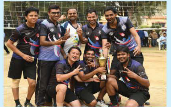
विजेता टीम - डीआईपीआर