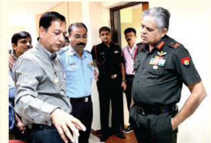
उत्कृष्ट वैज्ञानिक तथा निदेशक, केयर संस्थान में पधारे लेफ्टिनेंट जनरल के साथ विचार-विमर्श करते हुए

संबंध में संक्षिप्त विवरण प्रस्तुत किया जिसके पश्चात सुरक्षा प्रणालियों तथा जीआईएस प्रौद्योगिकियों के क्षेत्र में कृत्रिम ज्ञान तथा रोबोटिकी केंद्र (केयर) द्वारा विकसित की गई प्रौद्योगिकियों पर विचार-विमर्श तथा प्रदर्शन कार्यक्रम आयोजित किया गया।