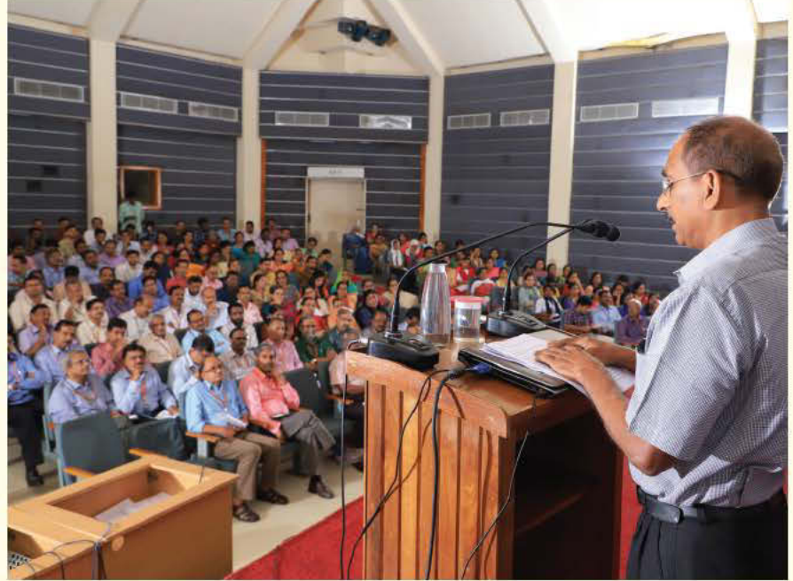
नौसेना भौतिक तथा समुद्र विज्ञान प्रयोगशाला (एनपीओएल), कोच्चि में डीआरडीओ वार्षिक दिवस समारोह का आयोजन