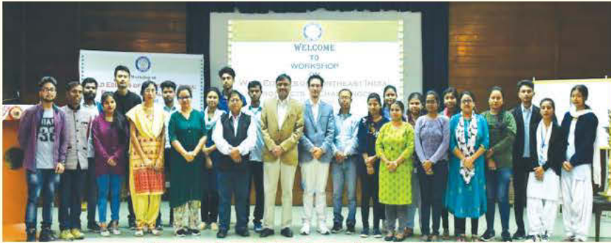
डीआरएल, तेजपुर में आयोजित कार्यशाला का ग्रुप फोटो

एवं चुनौतियां, आदि विषयों पर विशेष रूप से चर्चा की गई।