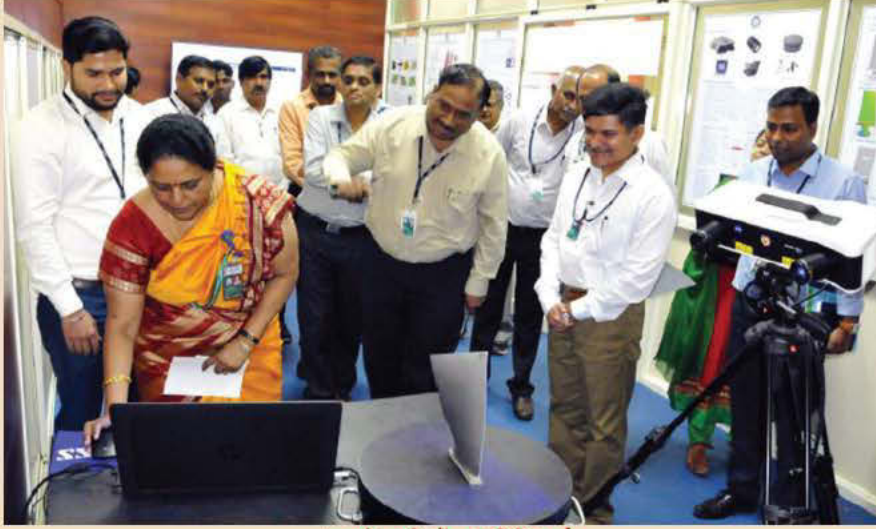
एनसीएमसी सेंटर, जीटीआरई

डॉक्टर टेसी थॉमस, विशिष्ट वैज्ञानिक तथा महानिदेशक, वैमानिकी प्रणाली ने 21 नवंबर 2019 को गैस टरबाइन अनुसंधान स्थापना (जीटीआरई) के क्यूए-वेन्स एंड ब्लेड सेक्शन में निदेशक, जीटीआरई तथा गैस टरबाइन अनुसंधान स्थापना (जीटीआरई) के वरिष्ठ वैज्ञानिकों की उपस्थिति में असंस्पर्शी मापन केंद्र (एनसीएमसी) का उद्घाटन किया।