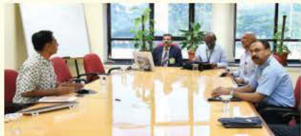
उत्कृष्ट वैज्ञानिक तथा निदेशक, केयर संस्थान में पधारे अतिथियों के साथ विचार-विमर्श करते हुए