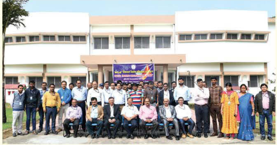
प्रशिक्षण कार्यक्रम का ग्रुप फोटो

इस कार्यक्रम का उद्देश्य मतलब (एमएटीएलएबी) सॉफ्टवेयर के संबंध में प्रतिभागियों की जानकारी को अद्यतन करना था। इस प्रशिक्षण कार्यक्रम के दौरान मतलब सूट सॉफ्टवेयर से संबंधित विभिन्न विषयों जैसे कि मतलब सूट से संबंधित आधारभूत जानकारी, मतलब सॉफ्टवेयर के