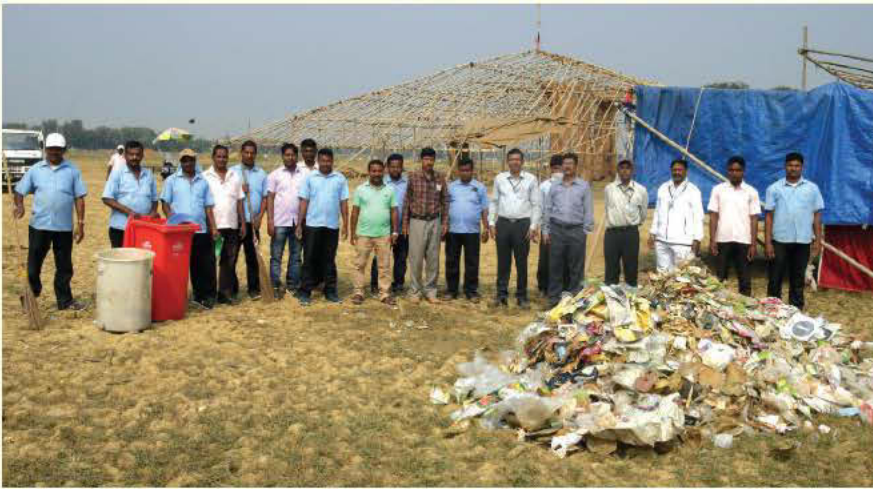
स्वच्छता पखवाड़ा के दौरान आईटीआर के कर्मचारियों द्वारा चांदीपुर समुद्री तट से एकत्र किया गया कचरा

स्वच्छता पखवाड़े का आयोजन किया गया जिसमें आईटीआर के परिसर के भीतर