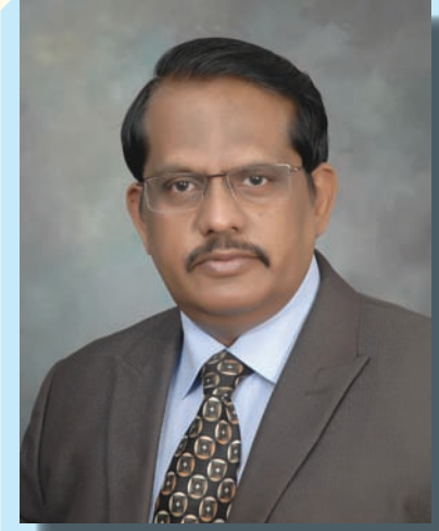
डॉ. एस. क्रिस्टोफर सचिव, रक्षा अनुसंधान तथा विकास विभाग एवं अध्यक्ष रक्षा अनुसंधान तथा विकास संगठन (डी आर डी ओ)

यह स्फूर्ति, यह गति बनी रहे। यह ऊर्जा अत्यधिक तेजी के साथ सभी असंभवों को संभव बनाती जाए। इस संगठन में कार्य कर चुके